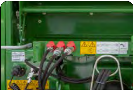
Hidrolik Hortum Tutucusu