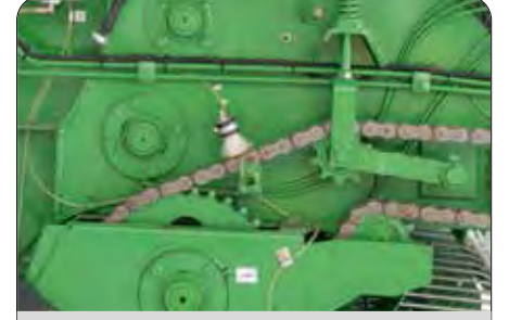
Otomatik Zincir Yağlama Fırçası