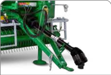
Ayarlanabilir Çeki Oku ve Başlığı