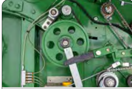
File Kesme ve Kavrama Sistemi