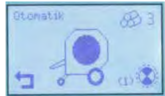
Otomatik alıřma Modu