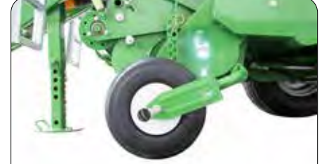
Ayarlanabilir Tabla Destek Teker