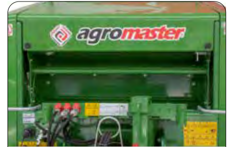
Kolay File Takma Sistemi