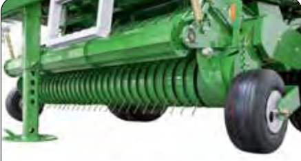
Hızlı Toplayıcı Pikap Düzeneği