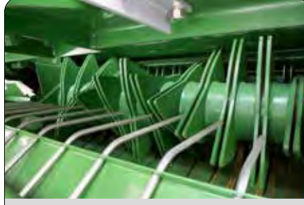
Ayarlanabilir Haşbay Düzeneği