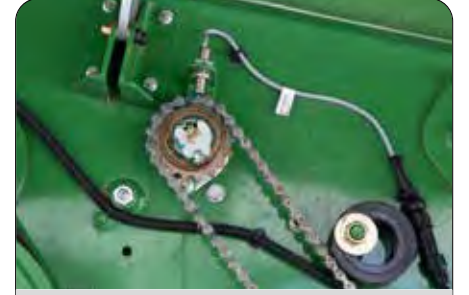
File Sarım Sensörü