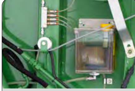
Zincir Yağlama Ünitesi