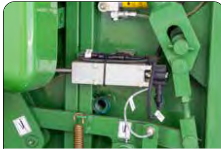
Hassas Dolum Sensörü