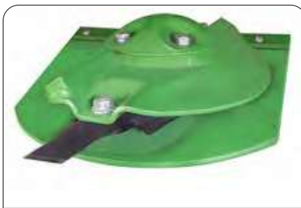
Geliştirilmiş Disk Tasarımı ve Bıçak Sistemi