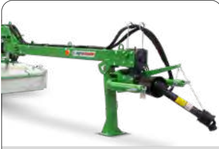
Uzun Çeki Oku ve Geniş Açılı Bağlantı