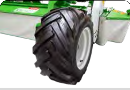
Geniş Taşıma Teker