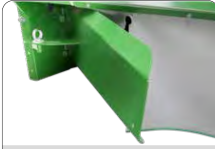
Ayarlanabilir Namlu Genişliği