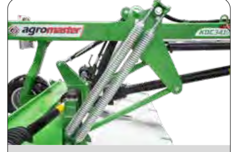
Geniş Süspansiyon Şasesi ile Stabil Kesme Yüksekliği