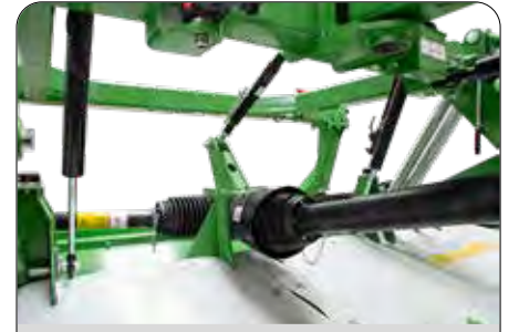
90° Çalışabilir Güç Aktarım Sistemi