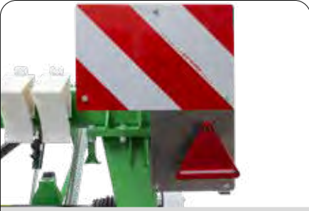
Modern Sinyalizasyon ve Reflektör