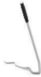
Bıçak Montaj Kolu

Bıçak tablasının ön ve arka kısmındaki özel kol ile hızlı ve kolay bıçak değişim imkanı