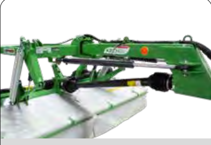
Çift Yönlü Teleskopik Şase