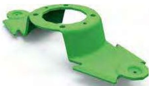
Merkezi Bıçak Tutucu

Bıçak tablasının detaylıca temizlenmesini sağlar. Yüksek kaliteli sertleştirilmiş çelikten yapılmıştır. 360 derecelik dönüş hızlı ve kolay değişim