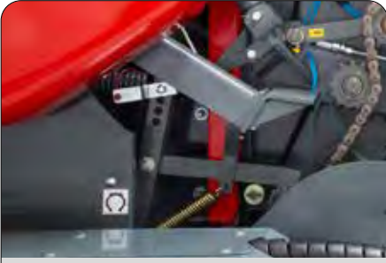
Balya Yoğunluk Ayarı