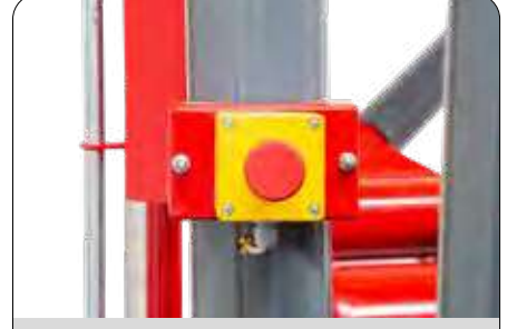
Acil Sistem Durdurma Butonu