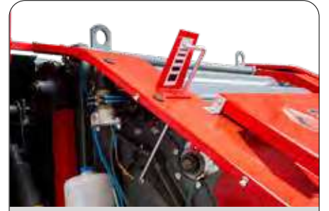
Balya Dolum Göstergesi