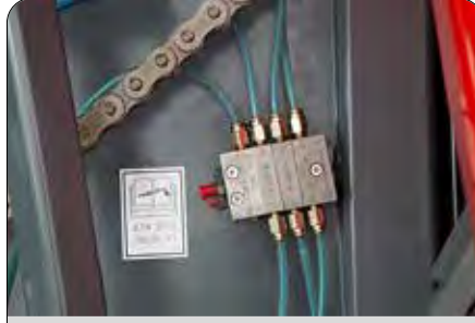
Merkezi Rulman ve Yatak Yağlama Sistemi