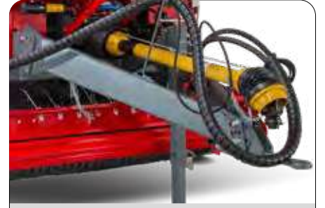
Ayarlanabilir Çeki Oku ve Başlığı