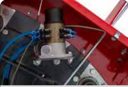
Otomatik Zincir Yağlama Sistemi