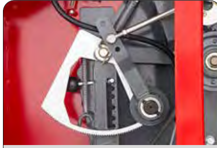
File Kat Sayısı Ayarı