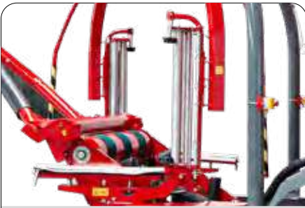
50 ve 75 cm'e Uyumlu Balya Sarma Ünitesi