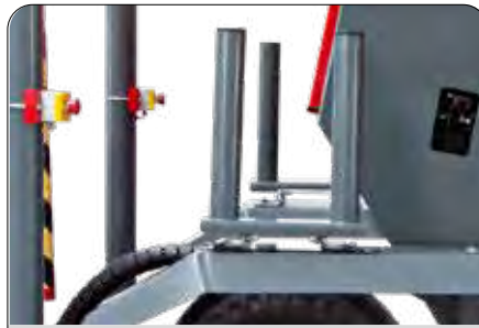
Yedek Streç Taşıma Aparatı